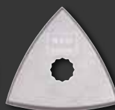
Brusná deska Náhr.díl číslo 303590002