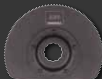
Kruhový řezný list 85 mm Obj. číslo 4932352614